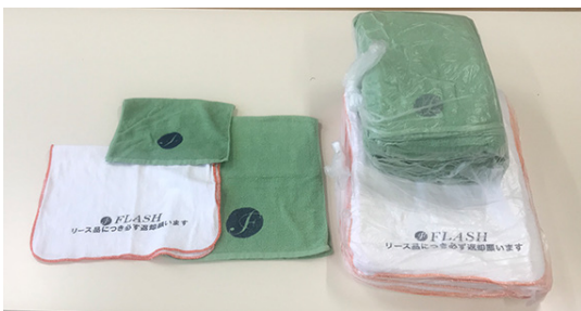
下用タオル ショートタオル(280mmx420mm) ドビー清拭布(390mmx640mm) フェイスタオル(340mmx860mm)