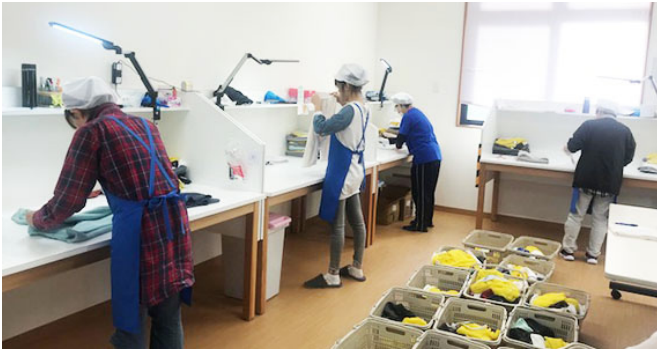
③たたみ作業・仕上げ作業