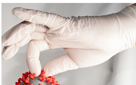
プラスチック手袋