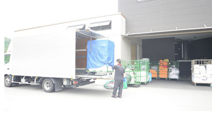
②ストックヤードへ 回収した洗濯物はストックヤードへ