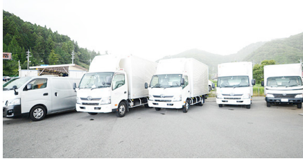
①回収 集配は、トラック5台と バン1台で行っています