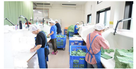
⑤たたみ作業・仕上げ作業