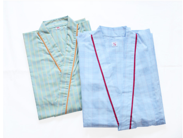
病衣(セパレートタイプ・ガウンタイプ)