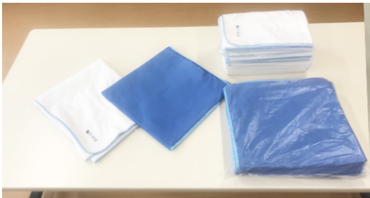
防水シート(パイル地・デニム地)